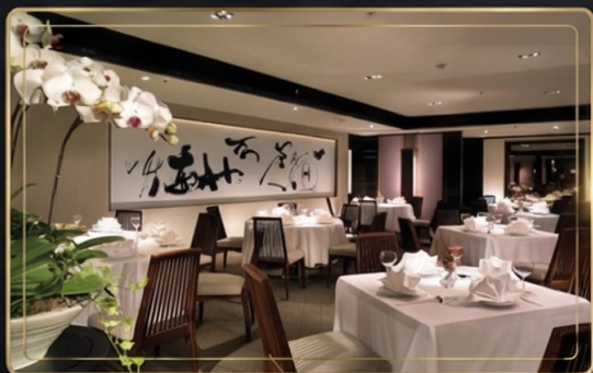
亞都麗緻大飯店—天香樓