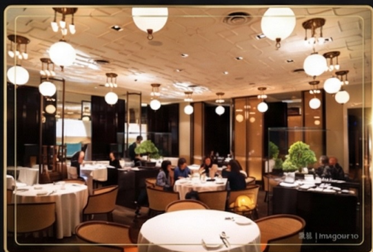
文華東方酒店—雅閣