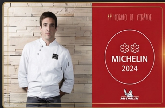
慕舍酒店—渥達尼斯磨坊