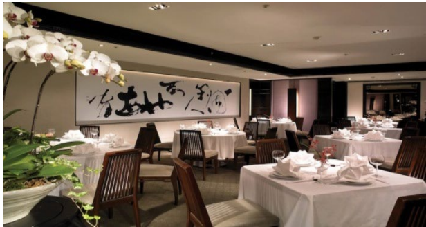
亞都麗緻大飯店 - 一天香樓