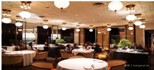
文華東方酒店 - 雅閣