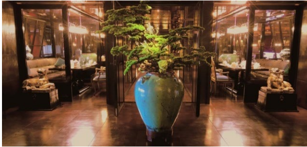
君品酒店 - 頤宮